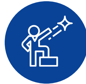
Abuso de autoridad