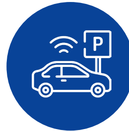
Uso incorrecto de activos