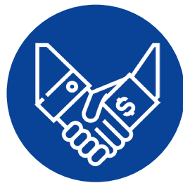
Actos de corrupción

En caso de presentarse en alguna situación que contravenga lo manifestado en este código de ética y conducta, usted debe reportarlo ante los siguientes casos: