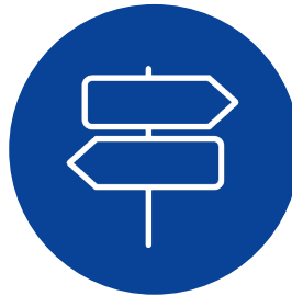
Conflictos de interés