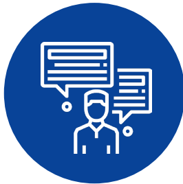
Divulgación de información